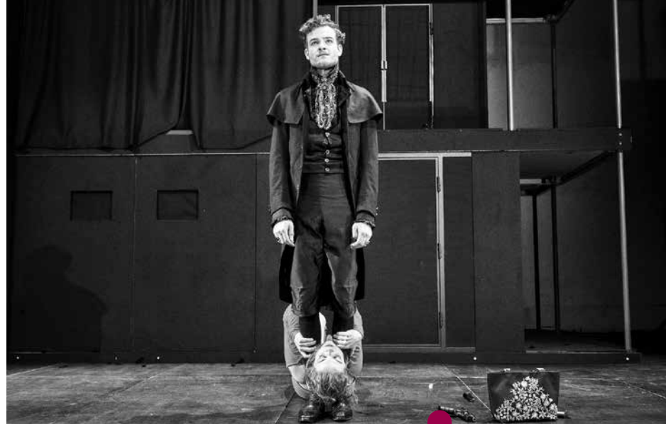
MODROVOUS – NADĚJE ŽEN (Studio Hrdinů)

To, čo Jelineková spracováva v inotajoch, priamočiarejšie, no kombináciou jazykov fyzického divadla, súčasného tanca, živej hudby a výraznej scénickej architektúry, prizvukovalo Útočisko Farmy v jaskyni. Tvorivú metódu pražského zoskupenia na čele s duchovným otcom Viliamom Dočolomanským, ktoré sídli v Centre súčasného umenia DOX, asi netreba predstavovať. Tentoraz spracovávajú problematiku migrácie, skúsenosti utečencov z Tibetu. Konkrétne príbehy nezrkadlia na javisku dokumentárnym spôsobom. Skúsenosti prechádzajú metamorfózou – myslením a videním režiséra, choreografa, scénografky a celého tímu a vpisujú sa do tiel tanečníkov aj hudby. Situácie z tibetských výpovedí sa stali súčasťou divadelnej cesty trojice univerzalizovaných emigrantov. Nad hlavami tanečníkov visia zlovestné amplióny, symbol väzenia, nepreniknuteľných hraníc, všetkého, čo môže ich cestu prekaziť.