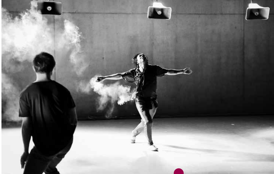
ÚTOČIŠTĚ (Farma v jeskyni)